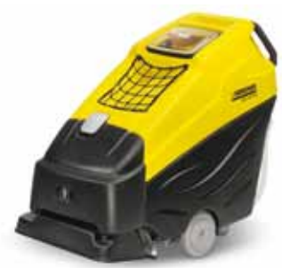
BRC 50/70 W Bp/Bp Pack