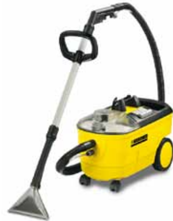
Puzzi 100 Super