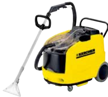
Puzzi 300 S

Olyan tartozékokkal, mint például az ablaktisztító készlet a Puzzi készülék számos további alkalmazásban is megcsillogtatja képességeit.