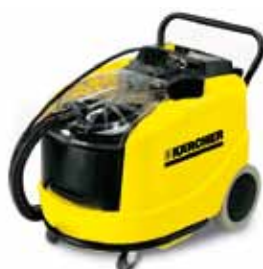
Puzzi 400 E