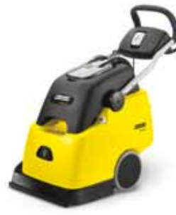
BRC 45/45 C Ep