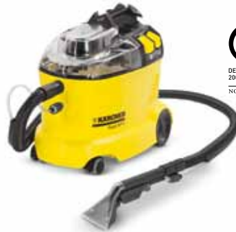
Puzzi 8/1 C

A Puzzi 8/1 C 9,3 kg súlyával könnyen hordozható és gyorsabb száradásának köszönhetően ideális a köztes tisztításhoz például szállodákban.