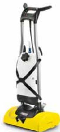
BRS 43/500 C

A kezelőelemek egyszerűek, biztonságosak és érthetőek. A robusztus kialakításnak köszönhetően a készülék nagyobb ütközés esetén sem károsodik.