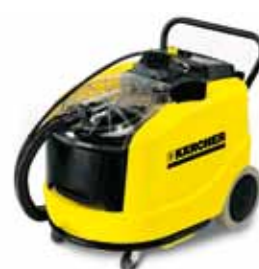
Puzzi 400 K