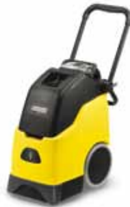
BRC 30/15 C

A BRC 50/70 W készülék az úszó csapágyazású keféj mellett kiegészítésként két ellentétesen forgó hengerkefével is rendelkezik.